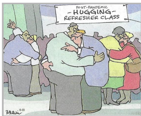
Clase de ABRAZOS después de la pandemia